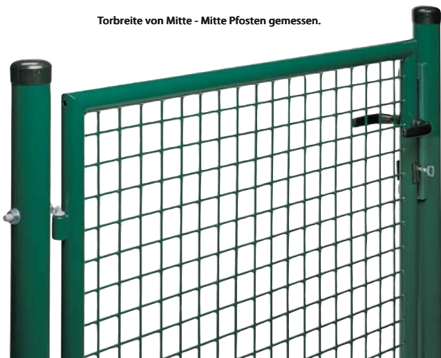
Torbreite von Mitte - Mitte Pfosten gemessen.

FEUER VERZINKT komplett feuerverzinkt, Alu-Drückergarnitur, Schrauben und Muttern aus Edelstahl.